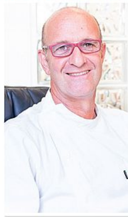
Dr. Cesare Paoleschi fondatore delle cliniche dentali IRIS

Nei casi di grande atrofia ossea al mascellare, cioè di scarsa quantità di osso nell'arcata superiore, è possibile intervenire con gli impianti zigomatici , tecnica chirurgica che evita l'innesto di osso e consente di posizionare una protesi fissa direttamente